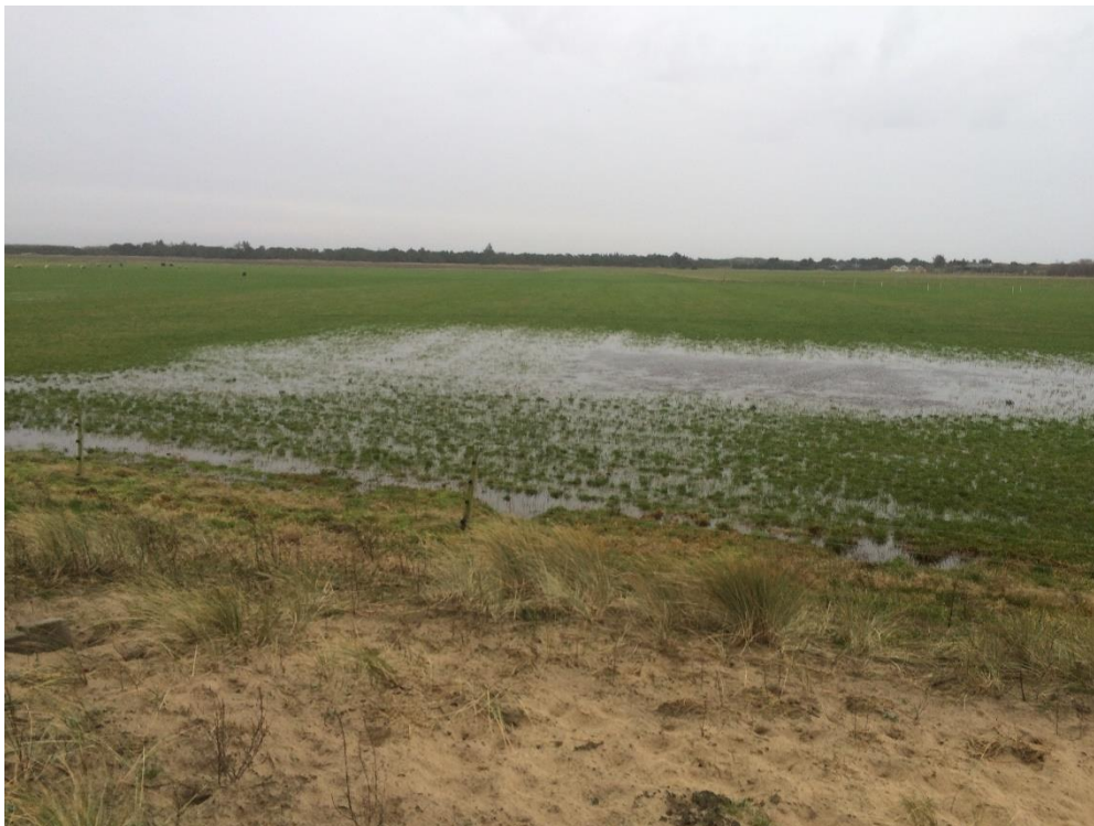
Figur 2. Foto fra det tilbageværende overdrev set mod syd. Her skulle der have været en klit med overdrev, hvor der i dag er dyrket græsmark.

Det oprindelige overdrev var en del af et større klitareal med overdrev. I 1999-2001 fjernes den sydlige spids af klitten (ca. 200 m 2 ), og arealet opdyrkes. Ud fra Danmarks Højdemodel 2015 vurderer vi at den sydlige spids har skrånet fra markniveau, kote 5,8m, op til kote 6,8m (DVR90). Det tilbageværende registrerede overdrev er beliggende ca. i kote 6,0m-7,8m.