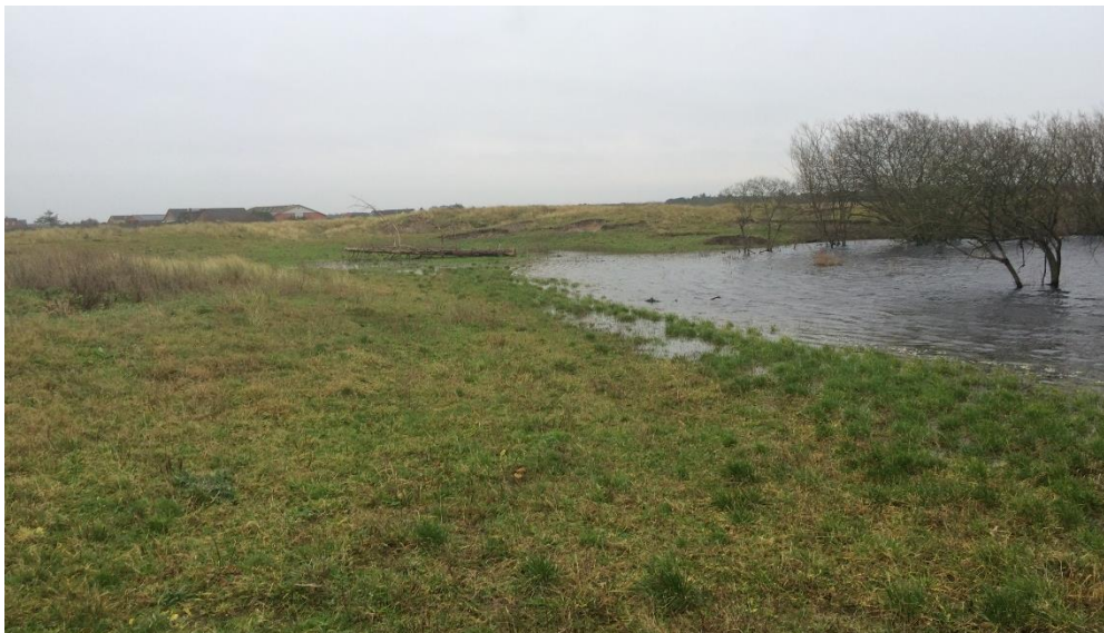
Figur 3. Foto af den dyrkede lavning der skal anvendes til erstatningsnatur. Søen er gået over sine bredder og oversvømmer en del af arealet.

For at kunne genskabe et overrevsareal i stil med det bortgravede, skal den genopbyggede klit hæves over niveau for vinteroversvømmelse, så arealet bliver både tørt og næringsfattigt. Det er ikke tilstrækkeligt blot at udtage den dyrkede mark af omlægning og gødsning, for så vil arealet blive tilført næring fra sø og mark ved vinteroversvømmelser. Terrænkoten for en genopbygget klit må derfor være minimum 6,2 m.